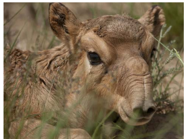
Saiga-Jungtier im Steppengras

„Altyn Dala“ ist besonders für die stark gefährdete Saiga Antilope ( Saiga tatarica ) von großer Bedeutung, da die